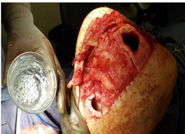
Figura 1. Perlas de sulfato de calcio con vancomicina antes de ser aplicadas dentro de los canales medulares femoral y tibial para prótesis de rodilla.

Se inscribieron un total de 87 sujetos en el período comprendido entre junio de 2019 a mayo de 2020, y cuatro de ellos fueron excluidos (el seguro institucional de los cuatro pacientes expiró, por lo que no se obtuvo seguimiento posoperatorio). Se evaluaron los 83 pacientes restantes, 44 casos fueron del sexo femenino (53%) y 39 casos del masculino (46.9%). La edad media fue de 76.6 (61-90) años. El IMC resultó ser el principal factor de riesgo (19.28%), seguido de la diabetes mellitus tipo 2 no controlada (18.07%). Todos los pacientes tenían al menos un factor de riesgo principal para presentar infección periprotésica (Tabla 2 ). Aunque se colocaron prótesis tanto de rodilla como de cadera,