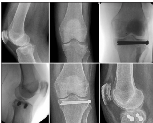
Figura 2: Fijación con tornillos

período desde la intervención quirúrgica hasta la consolidación radiográfica, tres (7,5%) pacientes demostraron colapso del segmento articular desde la posición lograda intraoperatoriamente, sin embargo, ninguno requirió cirugía adicional relacionada con el uso de GeneX o el colapso de la superficie articular. La incongruencia articular media final de aquellas superficies que habían sufrido colapso fue de 4,2 mm (3-5,3).