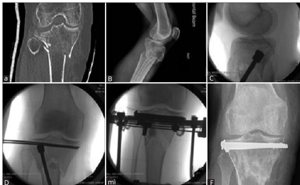
Figura 1: (a y b) Configuración de fractura mostrada en TC, (c) Elevación de la superficie articular, (d y e) Aplicación del marco con la aplicación GeneX, (f) Después de la extracción del marco que demuestra el mantenimiento de la superficie articular

bajo, y otros.: Efectividad del manejo del colapso óseo articular con defectos óseos en fracturas de platillo tibial con el uso de GeneX